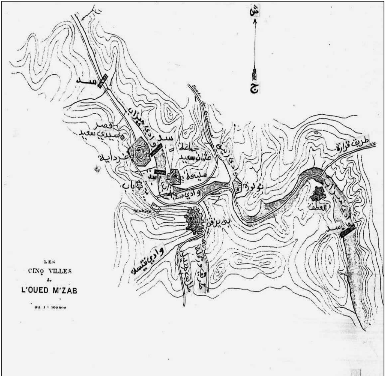
_DJILALI Sari,M'ZAB, Op.cit.,p13 :